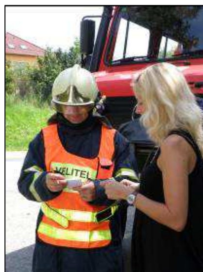
Obr. 4: Na výzvu velitele zásahu jste povinni poskytnout osobní či věcnou pomoc.

Osobní nebo věcnou pomoc nemusí poskytnout osoby, které požívají výsady a imunity dle mezinárodního práva.