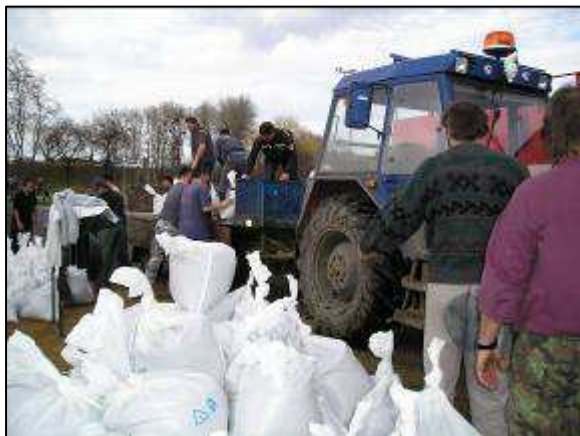
Obr. 5: Plnění pytlů s pískem při povodních.

Plnění těchto povinností můžete odmítnout , pokud byste jejich plněním ohrozili život nebo zdraví vlastní nebo jiných osob anebo pokud jsou povinnosti Vám ukládané v rozporu se zákonem.