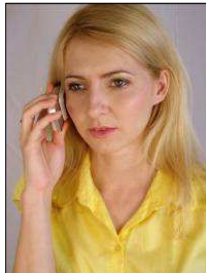
Obr. 2: Jste povinni ohlásit každý požár, i když jej uhasíte.