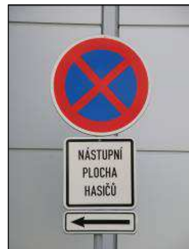
Obr. 3: Neparkujte na nástupních plochách pro hasiče!