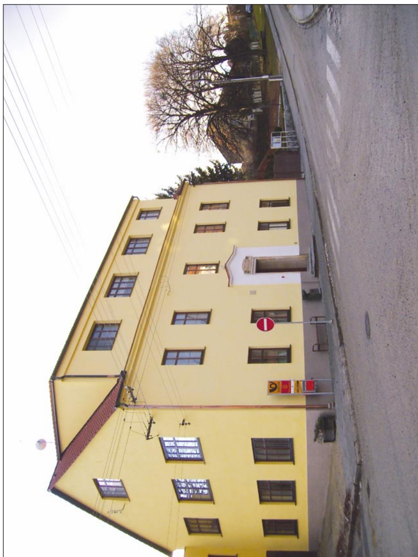
Obecní úřad po rekonstrukci