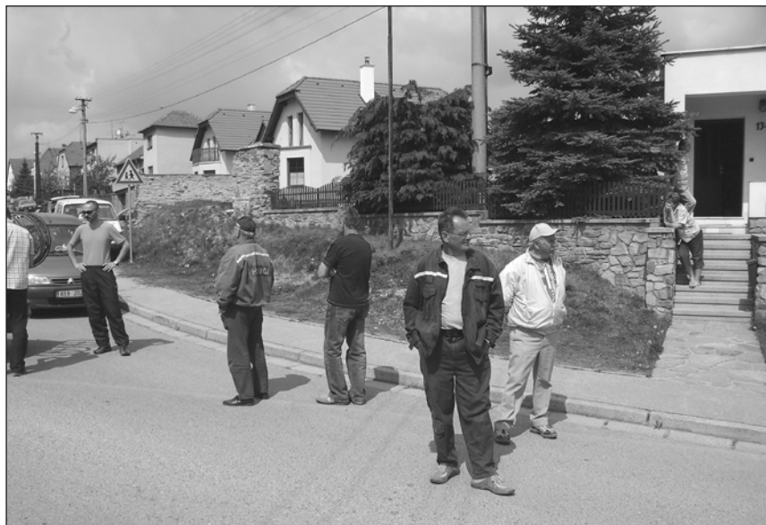
pořadatelská služba v akci

Tímto bychom chtěli za pořadající jednotu Favorit Brno poděkovat zejména zbraslavským dobrovolným hasičům za vydatnou pomoc při zajišťování této pořadatelsky velmi náročné sportovní akce.