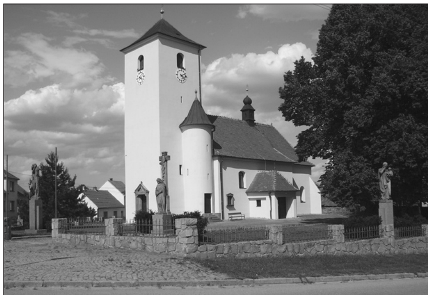
sochy u kostela Sv. Jiljí