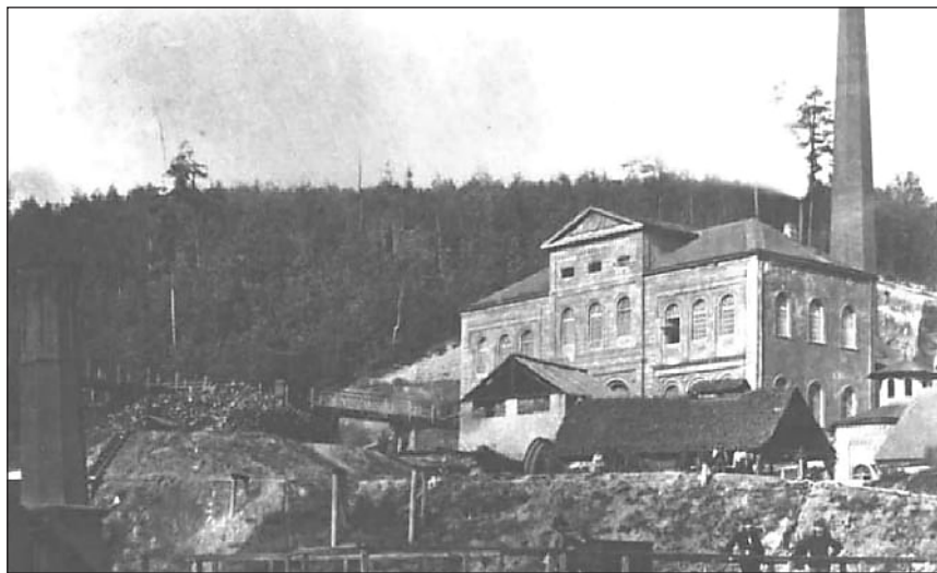
Jáma Herring 1888