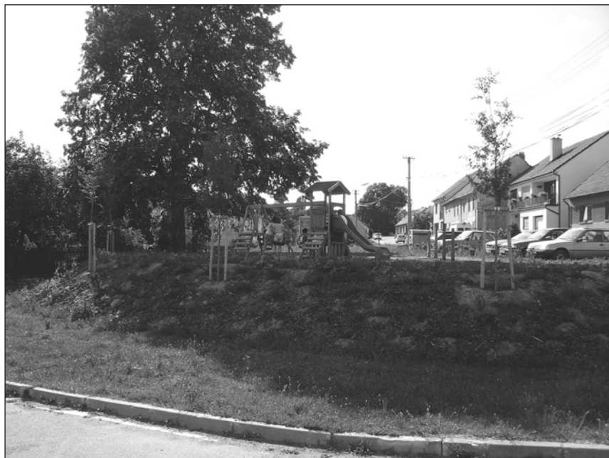
dětské hřiště v provozu